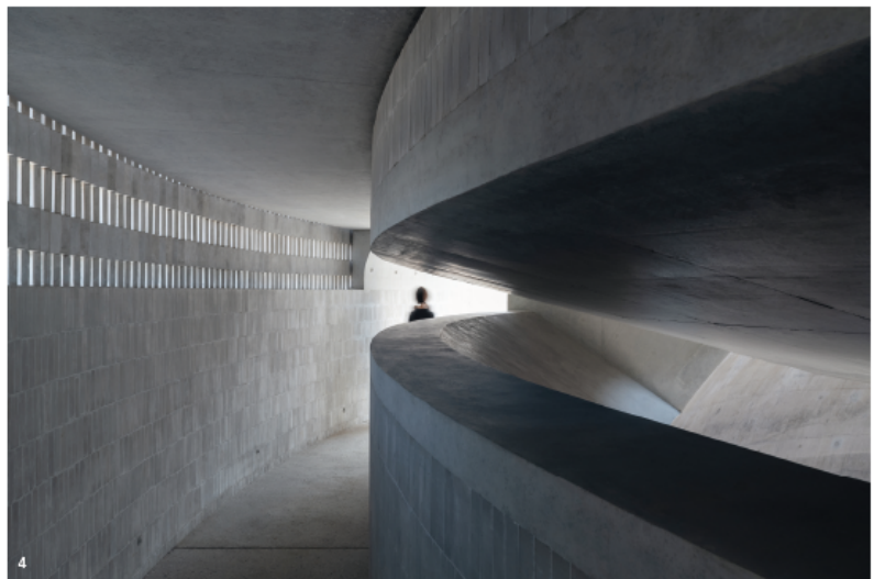
3 y 4. Un patio central abovedado, con una fuente de agua en cascada y al que abren cinco salas de degustación subterráneas, preside el edificio circular y parcialmente sumergido destinado a las catas de whisky.

La dicotomía china de los elementos que se oponen y complementan genera en esta destilería un equilibrio armónico entre arquitectura y paisaje, industria y experiencia, y montaña y agua.